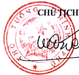
PHÓ THỦ TƯỚNG Vũ Đức Đam